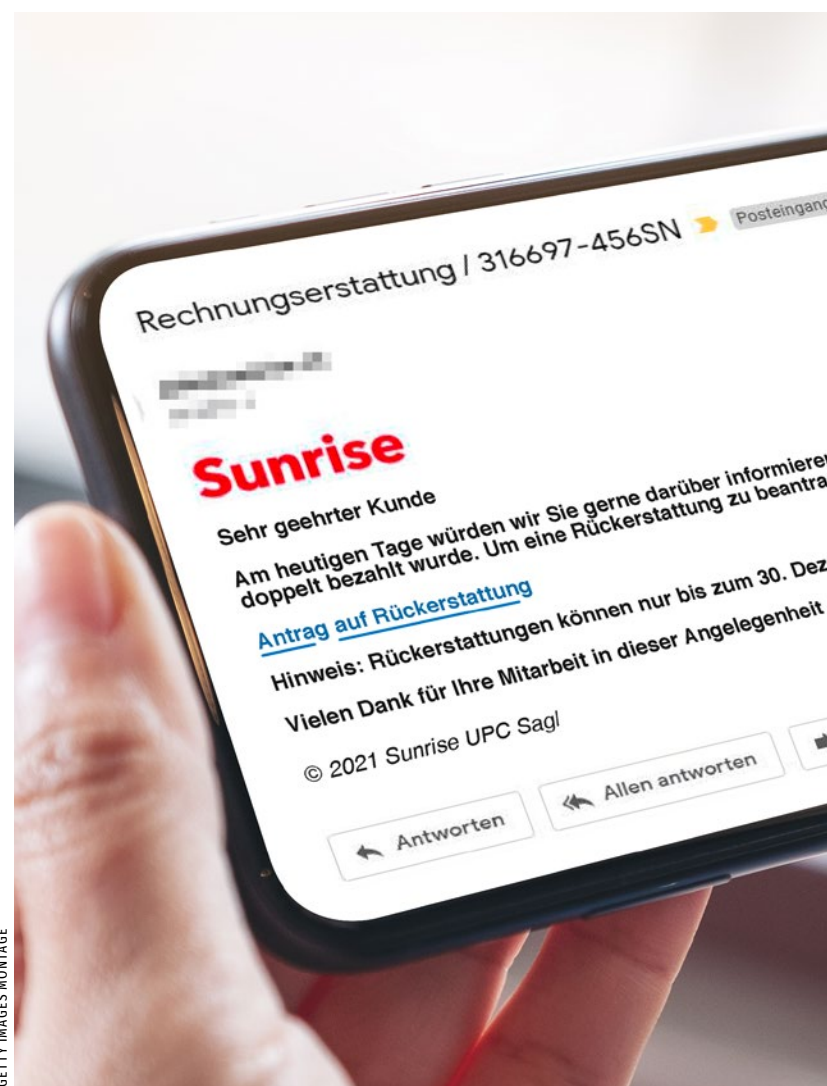
Das Phishing-Mail: Damit gelang es den Betrügern, die Herrschaft über die Kreditkarte zu übernehmen.

Cornèrcard schreibt dem Rentner Anfang Februar: Alle Transaktionen seien durch die Eingabe des korrekten SMS-Codes autorisiert worden. Deshalb bestehe «keine